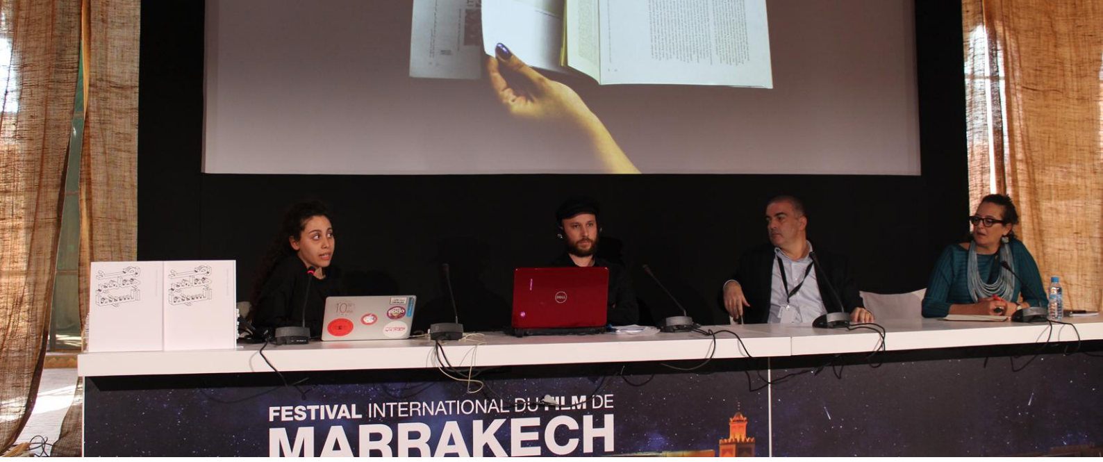
نقاش طاولة مستديرة بعنوان «جماهير السينما حول القارة الأفريقية: استراتيجيات ووجهات نظر» - مراكش، المغرب