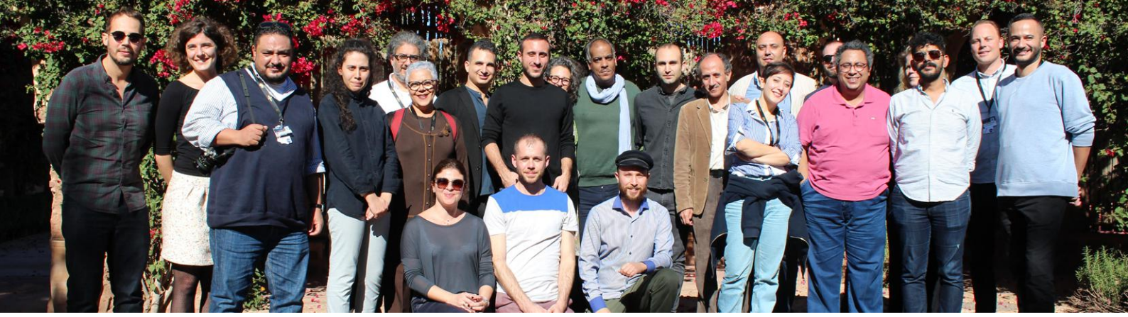
لقاء الجمعية العمومية الرابع لـ«ناس»، مهرجان مراكش السينمائي الدولي، في الثالث من ديسمبر/ كانون الأول، ٢٠١٨ - مراكش، المغرب