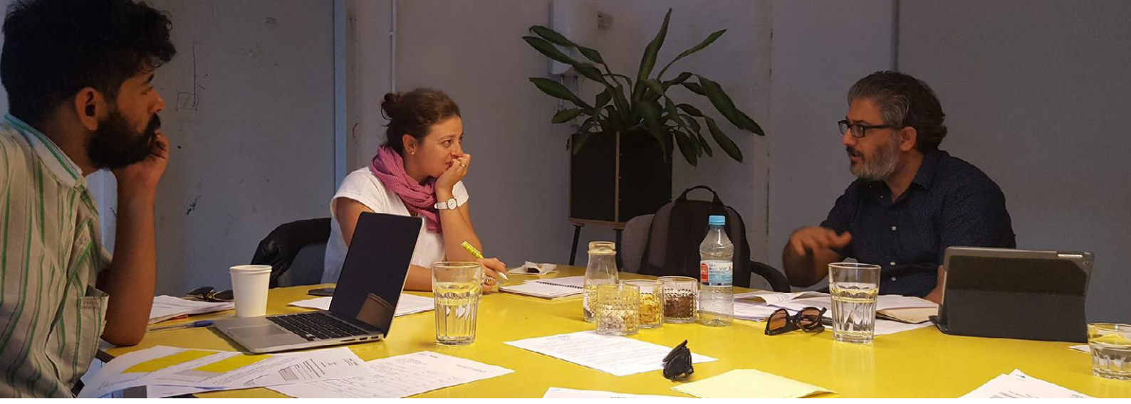
اجتماع لجنة تحكيم «مشابك سينائية» - برلين، ألمانيا Cinapses jury meeting - Berlin, Germany